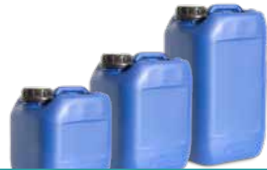
Nachfülltanks des Desinfektionsmittels